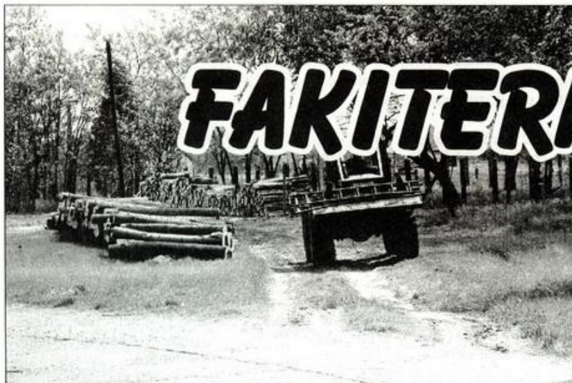
Folyik a fakitermelés az iskola udvarán