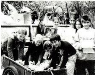
A hulladékgyűjtésben résztvevő gyerekek egy csoportja

Még januárban indítottunk el egy programot, melyben tisztasági versenyt és hulladékgyűjtési akciót hirdettünk meg. A tisztasági verseny célja, minden osztálynak a saját tantermében vigyázni kell a rendre. Szép, ízléses legyen a tanterem dekorációja, a padokban tisztaságot kell tartaniuk, a tanteremben nem lehet eldobott papír, szemét. A hulladékgyűjtési akcióban papírt és vasat gyűjtöttek a tanulók, május első heteiben. A gyerekek nagy lelkesedéssel járták a község utcáit, rengeteg hulladékot gyűjtöttek szorgalmas munkával. Dicséret illeti őket. Az akció jól sikerült.