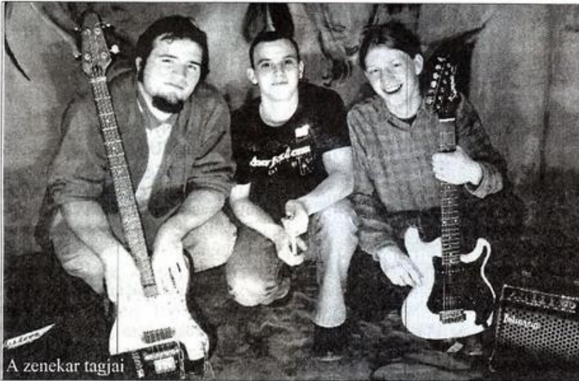
A zenekar tagjai