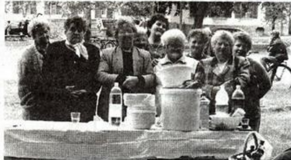
A Nyugdíjasklub főzőversenyen győztes csapata

szülők is bekapcsolódtak. Nagy élmeny volt a versenyzők és a nézők számára egyaránt. Közben a sportpályán kispályás labdarugó kupa zajlott az idősebb korosztályok részvételével. Délben mindenki megebédelt az itt készült friss meleg ételekből, majd a délutáni programok kezdődtek. A főzőverseny I. helyezését a Nyugdíjasklub kapta, mert a zsűri ízlésének az ő főztjük tetszett legjobban. A kispályán felállított színpadon felléptek az óvodások, iskolás csoportok, a Nyugdíjasklub asszonykórusa és az Egyesület Hagyományörző Csoportja. A közönség nagy