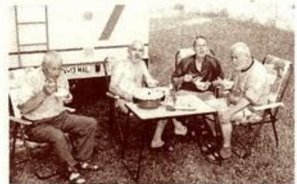
Vacsorájukat fogyasztják a zarándokok a Faluház udvarán

Minden bizonnyal kellemesen érezték itt magukat, így valószínűleg jó hírét viszik majd községünk vendégszeretetének.